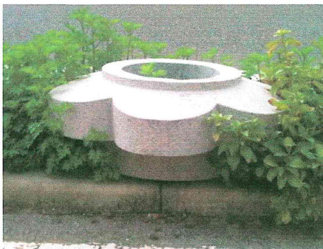
FOTO ALLEGATE OGGETTO DELL' INTERROGAZIONE: “ SISTEMAZIONE AIUOLE DI VIALE RIMEMBRANZE. ”