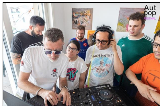
ragazzi di Facciavista e Il Veliero imparano a mixare le canzoni con una consolle da Dj