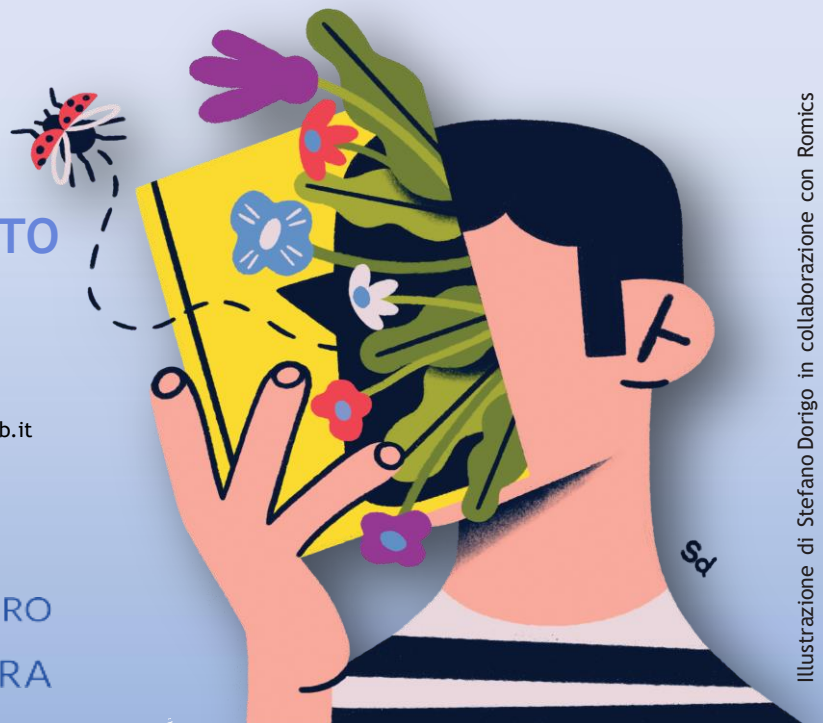
Illustrazione di Stefano Dorigo in collaborazione con Romics

PER INFORMAZIONI Biblioteca civica Via Italia 11, Vedano al Lambro 039 490633 biblioteca@comune.vedanoallambro.mb.it