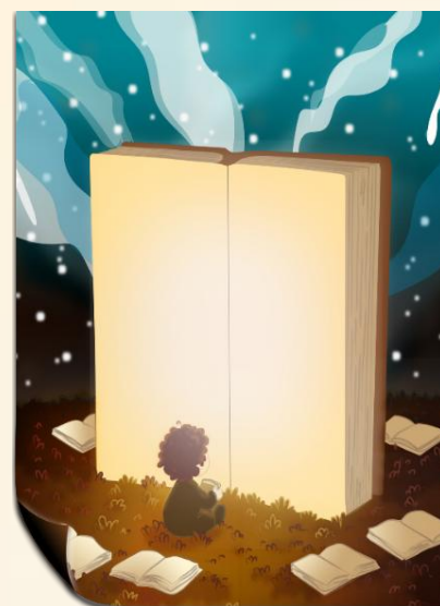
Illustrazione di Flavia Polzella in collaborazione con Romics